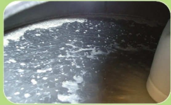
Δονούμενο κόσκινο AMKCO σε φιλτράρισμα τυρογάλακτος. Ανάκτηση έως 150 kg/h τυριού.