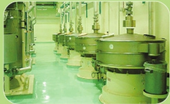
Δονούμενα κόσκινα AMKCO σε φιλτράρισμα κακαόμαζας.