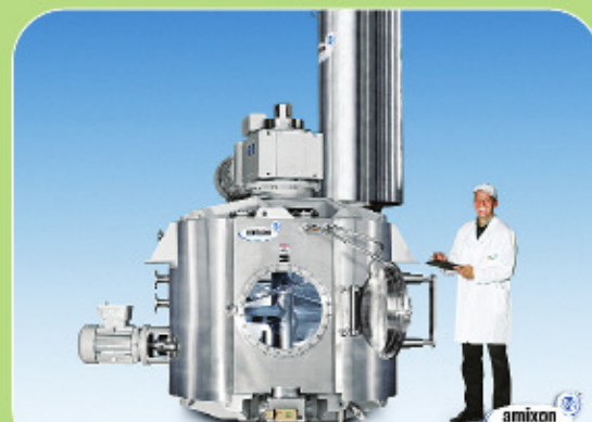
Ειδικός αναμίκτης AMIXON με δυνατότητα ξήρανσης.