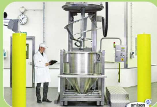
Αναμίκτης AMIXON για containers.