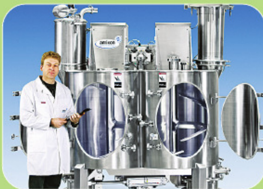
Κάθετος αναμίκτης AMIXON διπλού άξονα για συνδυασμό έντονης & ήπιας ανάμιξης.