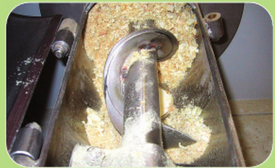
Συνεχής μέτρηση υγρασίας στην παραγωγή pellets βιομάζας.