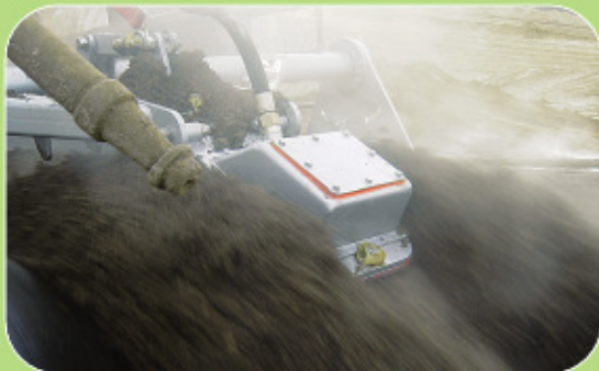
Μέτρηση υγρασίας στην τέφρα σε εγκατάσταση παραγωγής ενέργειας.