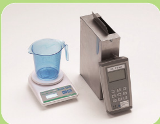
Φορητό όργανο μέτρησης υγρασίας.

Οι μετρητές της ACO είναι σχεδιασμένοι για on-line μέτρηση και ρύθμιση υγρασίας. Η μέτρηση γίνεται σε βάθος του προϊόντος (έως περίπου 150mm) και δεν επηρεάζεται από συγκέντρωση ακαθαρσιών στην επιφάνεια. Δεν μετράται μόνο η επιφανειακή υγρασία. Το αισθητήριο είναι σε επαφή με το προϊόν ή εναλλακτικά με ενδιάμεσο πλαστικό (π.χ. μεταφορική ταινία) ή γυαλί (π.χ. υαλοδείκτης σε σωλήνα μεταφοράς). Η έξοδος του αποτελέσματος μέτρησης μπορεί να είναι 4...20mA, 0/2...10V, και να μεταδοθεί σε δίκτυο Profibus ή υπολογιστή. Υπάρχει η δυνατότητα επεξεργασίας του σήματος (μέσος όρος τιμών περισσοτέρων του ενός μετρητών). Η βαθμονόμηση γίνεται με 2 έως 10 δείγματα (γραμμική ή πολυωνυμική) μέσω ειδικού λογισμικού. Η ακρίβεια μέτρησης μπορεί να φθάσει έως 0,05%.