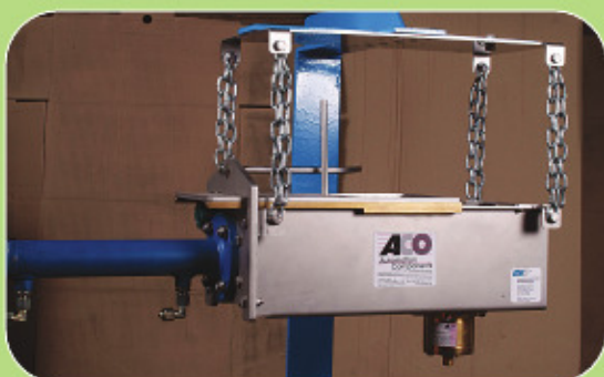
Σύστημα μέτρησης υγρασίας με συμπίεση προϊόντος κατάλληλο για αργιλόμαζα, βιομάζα, ...