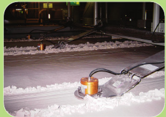
Μέτρηση υγρασίας σε εγκατάσταση παραγωγής ενέργειας.